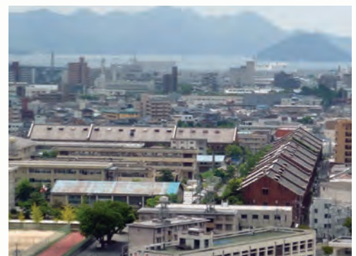
旧広島陸軍被服支廠(比治山陸軍墓地より)