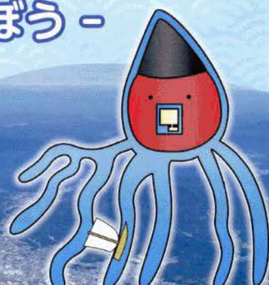
広島デルタの妖精 「でるたこ(初代)」