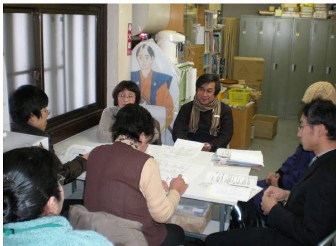
広島城、事務室の中でさえ寒くてすみません

メモリアルデー運営ボランティアさんの第2回ミーティングが2月24日(日)にあり、午後1時から4時頃まで、熱心に議論をしていただきました。具体的には、前回出された様々な企画案を見ながら検討を行い、大きく3つの企画を進めて行くことになりました。館内では普段上がれない武家屋敷などを使ったイベント、史跡広島城跡内のフィールドを使ったイベント、古文書入門的な