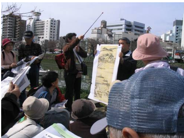
江戸時代の広島を思い浮かべながら

なお、ご参加いただける方は、必ず事前に広島城までご連絡ください。また、定刻になりましたら現地を出発しますので、時間に遅れる場合も必ずご連絡下さい。よろしくお願いいたします。