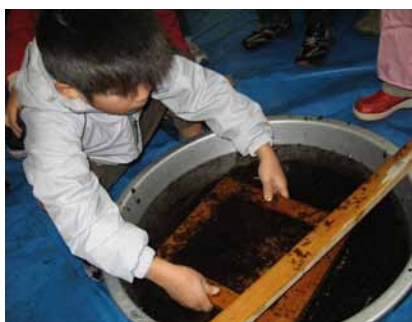
細かく刻んだ原藻を、紙すきの要領で

1月26日(土)に海苔すきの体験教室を開きました。市内で海苔養殖をされている方を講師に招いての初の試みです。かつての広島湾は、全国屈指の海苔の生産地でしたが、いまでは風前の灯です。その貴重な