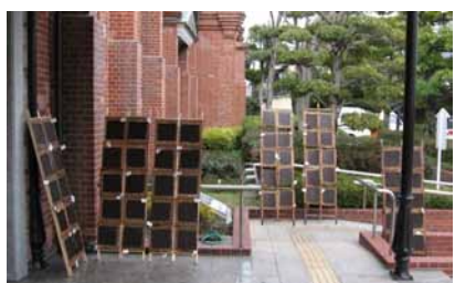
資料館の玄関に磯の香りが漂いました