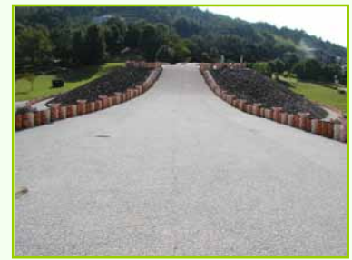
広島市方面から：西条バイパスを東へ、「三ツ城近隣公園」を過ぎてすぐを左折。駐車場あり。