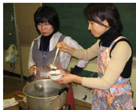
大河鍋(海苔汁)の試食です

1月26日(土)に海苔すきの体験教室を開きました。市内で海苔養殖をされている方を講師に招いての初の試みです。かつての広島湾は、全国屈指の海苔の生産地でしたが、いまでは風前の灯です。その貴重な