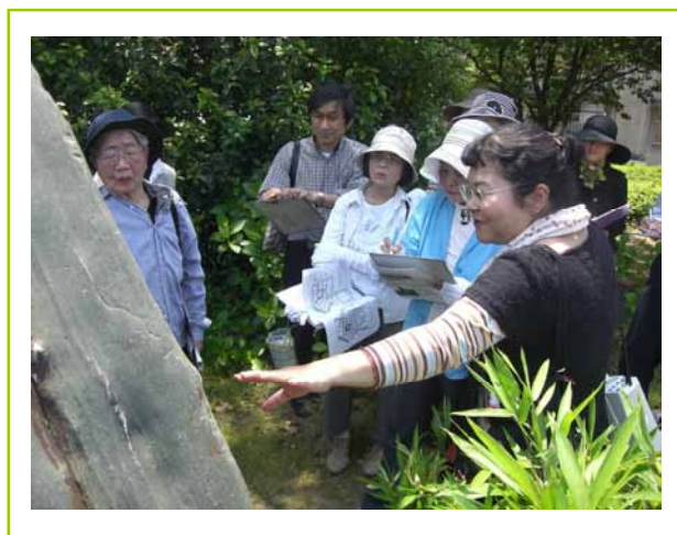
第二陸軍病院跡にある石碑を熱く語る学芸員