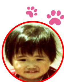
昭和時代のわたし

みなさん、お元気でしょうか。日ごとに広島でもコロナウイルス感染者の数が増え、ますますマスク・うがい・消毒が必須になってしまいました。そんな状況下ですが、広島城・郷土資料館・文化財課も新年度を迎え、ボランティア担当もメンバーチェンジがありましたので新人を紹介します。が、日原以外は担当経験者のため、フレッシュ感はありませんので、休館中でもお気軽にお問合せくださいね。(郷土資料館 山縣)