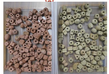
現在生産された粘土飾り。足りない…

しばらく途絶えていた、もの作りの事業が今年度増えた増えた！と喜んでいたら、さまざまなパーツが底をつきそうな事実が判明しました。特に緊急を要するのが縄文よりひも作りの「粘土飾り」です。先日研修で作っていただきましたが、まだまだ足りません。更なる増産のご協力をお願いします。粘土塊に穴をあけ、竹串等で自由に模様をつけます(後日職員が