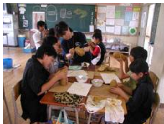
埴輪づくり 倉掛小学校にて 作業の細かな部分にきちんと目を配り、小学生にもわかりやすい的確な指導をしておられました。

7月以降は、すでに「土器作り」など同じ内容で何回も指導経験を積んだボランティアさんの中から希望される方に、出張授業全体を担当していただく計画もあります。その様子については、改めてご報告しますのでどうぞお楽しみに！！（文化財課 荒川）