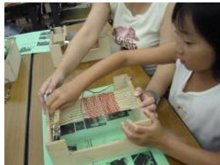
麻布コースター作り

イベント盛りだくさんの夏休みに向けて、7月15日(日)の10:00~12:00、郷土資料館でボランティア研修会を開きます。今回の研修メニューは、麻布コースター作り 被爆建物レクチャー 広島城被爆痕跡レクチャーです。