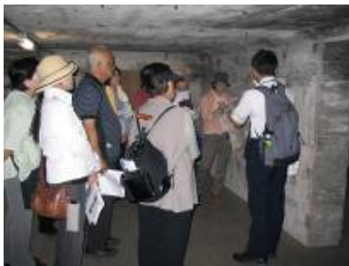
地下通信室の中で

いました。また、石に刻まれた刻印さがしでは、日が陰って見にくい中、「あそこにある」「ここにある」と次々に見つけれられました。