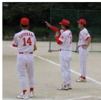
往年の名選手たち

そうだったこと。OBの方たちの活躍を知っているのでしょうか。かつての野球少年たちの目はとても輝いていました。受付から球拾いまで指導の補助に駆け回っていただいたボランティアの方々も、大変だった半面、そんな姿を見て楽しんでいただけたのではないのでしょうか。