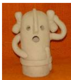
試作した埴輪 製作指導に先立ってボランティアさんが試作されたものです。

文化財課では、去る6月に市内5つの小学校から依頼を受けて、ボランティアさんと一緒に出張授業にお邪魔しました。内容は、「土器づくり」、「埴輪づくり」、「勾玉づくり」、「土器の野焼き」でした。