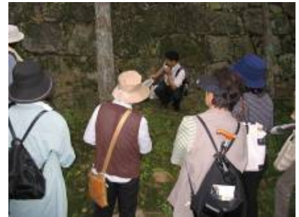
石垣の矢穴の解説

6月の全体研修会は、17日(日)13:00から、史跡広島城跡でのフィールドワーク「探ろう!広島城」を実施しました。二の丸に集合し、本丸内のポイントを石垣を中心にたどりましました。