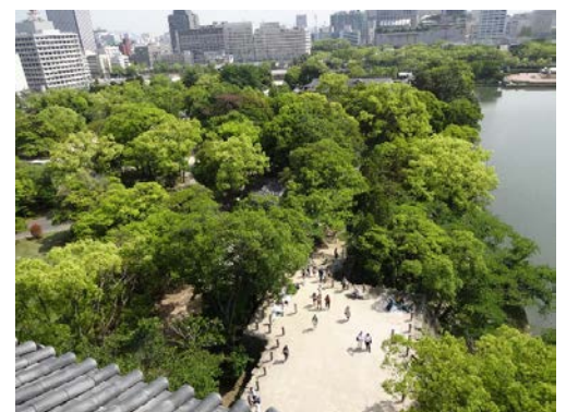
城内の生い茂る樹木 (天守閣より撮影)

5月中旬、広島城天守閣への上り階段傍のソメイヨシノからなんとなんと、赤い実を数個見つけました。これは珍しいことのように。さて、内堀に囲まれた現在の広島城は約12万㎡。その中に約65種類、1,200本余りの樹木を見ることができます。季節ごとに私たちの目を楽しませてくれる樹木ですが、皆さんがお客様にガイドをしていると、「この木何の木?」と問われる