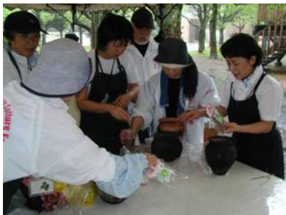
炊飯の準備をする“モグラ軍団”です。