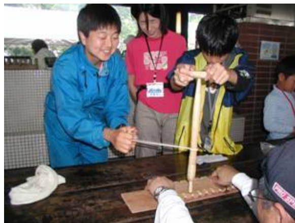
湿度が高かったにもかかわらず火をつけることができました。