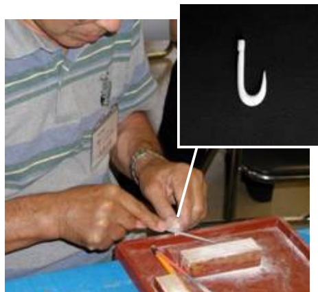
根気よく削っていきます。

鹿の角は、加工がしやすく適度な硬さもあるので、古代からアクセサリーや生活道具の材料として利用されてきました。広島県内の縄文時代の遺跡(帝釈峡にある洞くつ遺跡です)からも、鹿角製の釣り針が発見されています。実際、昨年の事業では、自分で作った釣り針を使って、たくさんのニジマスを釣り上げました。細くても意外に丈夫なんですよ！