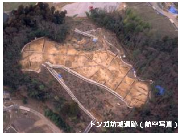
トンガ坊城遺跡(航空写真)