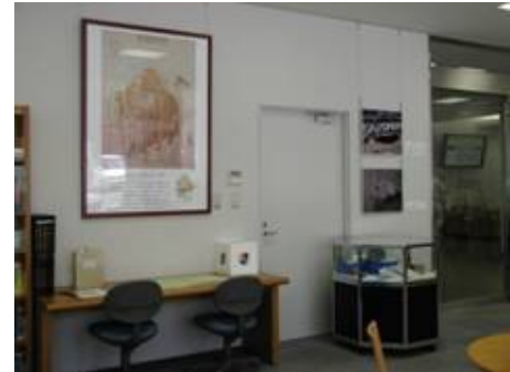
太田川河川事務所1階「Gogiルーム」にて展示中!見学は無料です。

今後は、こうした展示品の選出やパネルの作成などの“展示づくり”にも積極的に参加していただきたいと思います。やってみたい!と思われる方は声をかけてくださいね。