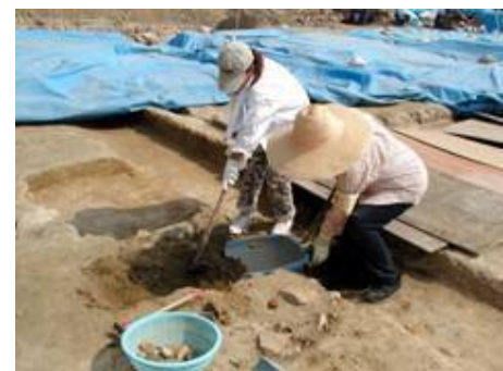
昨年の発掘調査体験のようす (会場:広島城跡法務総合庁舎地点)

また、同じ9月30日(土)には、安佐北区白木にある鎌倉寺山の登山と遺跡を巡るフィールドワークがあります。募集対象は白木地域の方々に限っていますが、スタッフとして2名程度ご協力いただければと思います。ぜひ行きたい!という