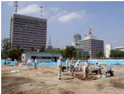
法務総合庁舎地点