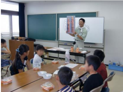
歴史の話や作り方の説明