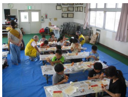
ミニフィギュアづくり