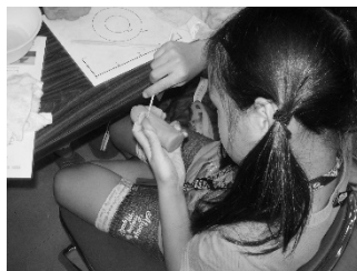
ミニフィギュアの製作