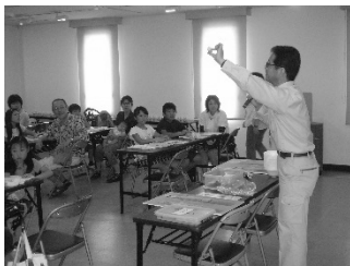
歴史の話や作り方の説明

公民館の研修室で、イベント「夏休み子ども考古学教室」を開催します。事前に申し込んだ小学生20人（3年生以下は保護者同伴）を対象に、10:00~12:00の2時間でミニフィギュアづくりを実施。最初に歴史の話や作り方の説明を聞いて、見本を参考に作って完成させます。文化財課の職員1名とボランティア2名が指導します。