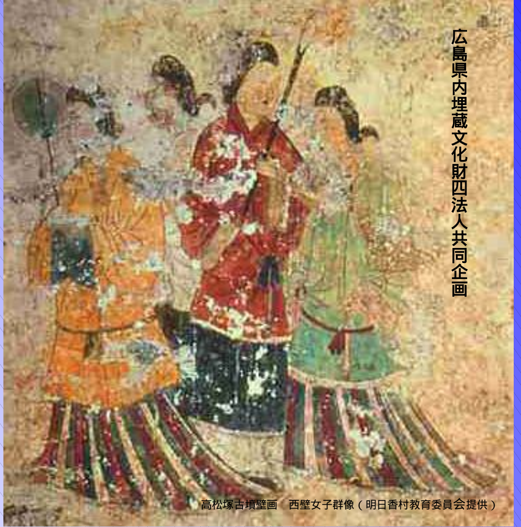
高松塚古墳壁画 西壁女子群像