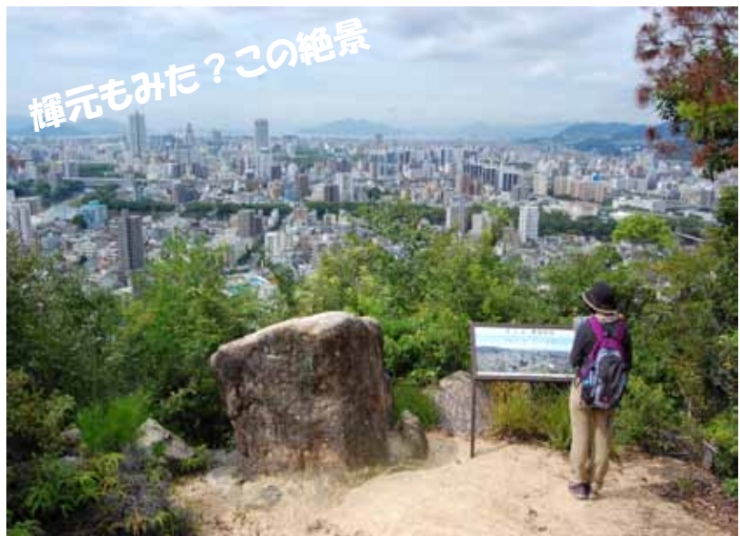
見立山からの風景