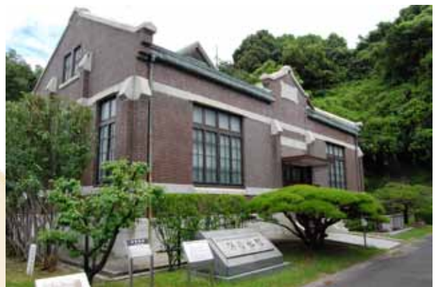
広島市水道資料館