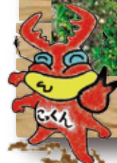
こんちゅう館キャラクター こっくん