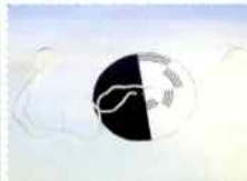
ビュンビュンCDこま