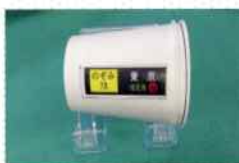
紙コップ行先表示器