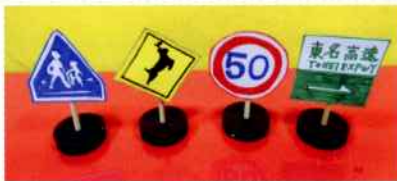
ミニチュア交通標識