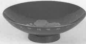
宇品陸軍糧秣支廠四十周年記念杯