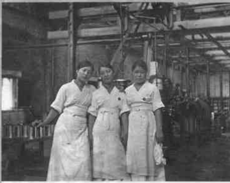
工場内女性工員 昭和5年頃(1930)