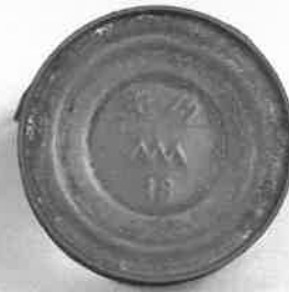
宇品陸軍糧秣支廠製造 牛肉缶詰缶