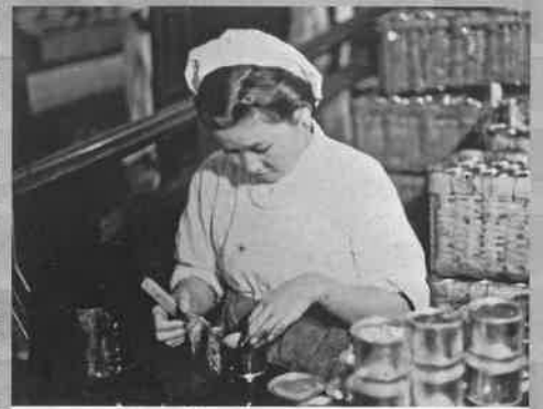
缶のニス塗り作業 昭和15~17年頃(1940~42)