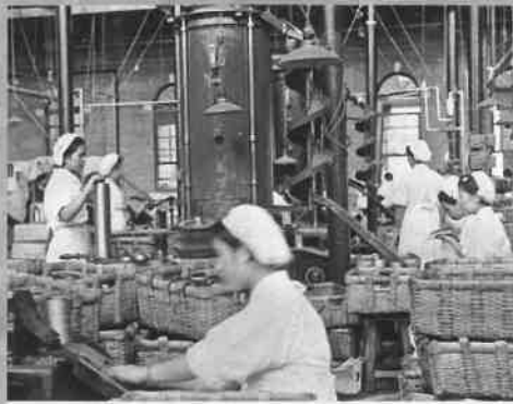
製缶工程 ライニングマシン 昭和15~17年頃(1940~42) (個人蔵)