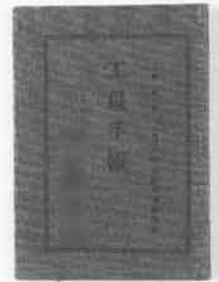
宇品陸軍糧秣支廠工員手帳