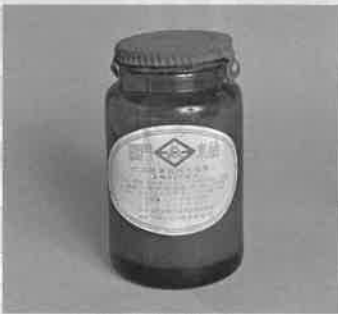
宇品陸軍糧秣支廠買上 水飴

缶詰工場の作業風景写真や使用されていた道具類などの当館収蔵資料を通して 缶詰工場の様子や宇品陸軍糧秣支廠が果たした役割を紹介します。