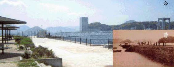
波止場公園(南区宇品)にある旧軍用栈橋あと

宇品港(昭和7年に広島港に改称)は、完成から5年後の明治27年(1894)、日清戦争に際して物資や兵隊を戦地へ送り出す港(軍用港)として用いられました。その後、昭和20年(1945)第二次世界大戦の終戦まで、広島は重要な軍事拠点として位置づけられ、宇品に設置された糧秣支廠もその一役を担いました。