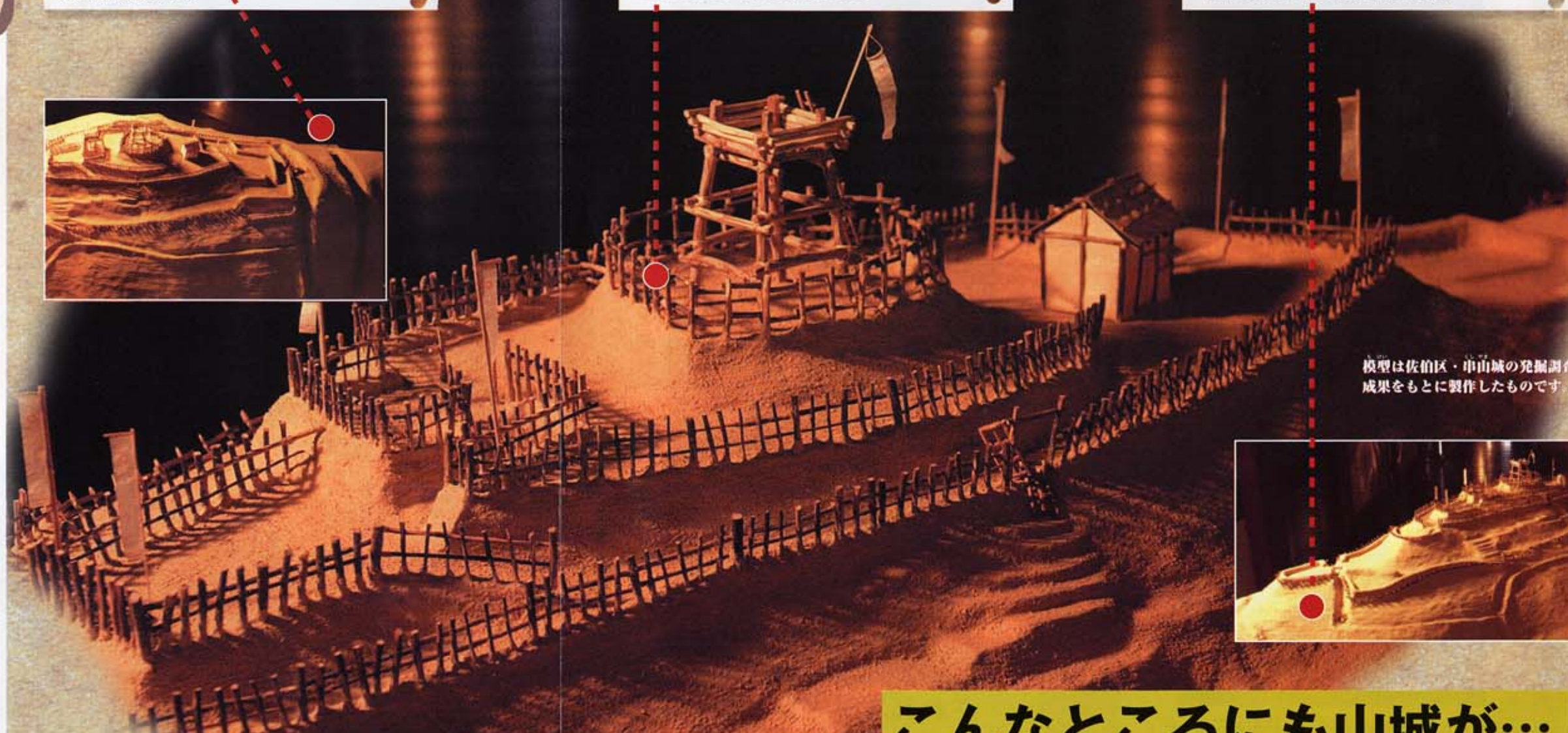
模型は佐伯区・中山城の発掘調査の成果をもとに製作したものです。

斜面にそって上下に掘られたたて堀は、登ってくる敵を横へ動きにくくするためのもので、上から攻撃するのに好都合でした。