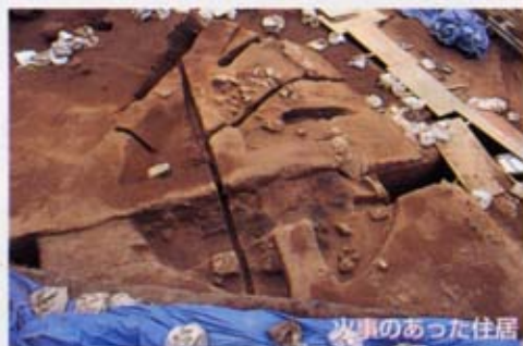
火事があった住居

安芸区中野東にある三谷遺跡は、瀬野川を見下ろす日当たりの良いゆるやかな斜面にあります。これまでの調査で、弥生時代中期後半から後期(約2000~1700年前)にかけての大量の土器や、竪穴住居跡約10軒を確認しました。三谷遺跡は、瀬野川流域の弥生ムラとしては初の本格的な発掘調査となります。今後の調査で、当時のこの地域の人々の暮らしが明らかになっていくでしょう。