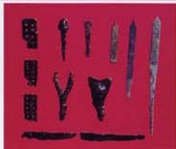
【武器・武具】佐伯区・有井城