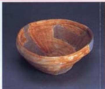
【すり鉢】安佐南区・伴東城

山城を発掘調査すると、鉄のやじりやよろいの部品といった戦争用の道具のほかに、焼き物などの生活道具も見つかります。それらの道具類は、城にたてこもった人たちが使ったものなのでしょう。