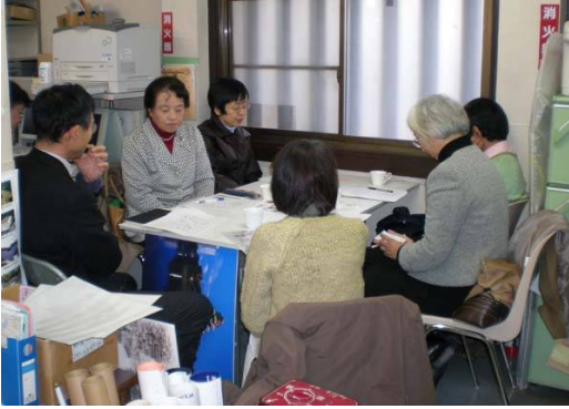
第1回ミーティング 色々な意見がでました。

過日、6月1日(日)に実施する50周年記念メモリアルデーの運営ボランティアさんを募集したところ、数名のボランティアさんに、ご参加いただけることになりました。その第1回ミーティングが1月27日(日)にありました。来年度の50周年事業の動きを紹介した後で、メモリアルデーに向