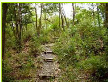
保存されている三つの古墳の墳頂をつなぐように、歩道が整備されています。