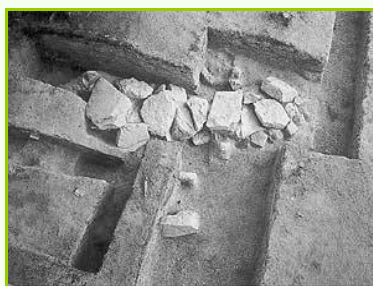
第1号古墳の埋葬施設。築造は4世紀後半~5世紀初頭と推定されています。