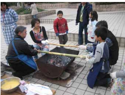
講師は広島城の谷館長です。