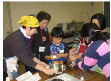
まずは生地作りです。

郷土資料館では1月19日(土)にバウムクーヘン作りの体験教室を開きました。郷土資料館とバウムクーヘン？と思われるかもしれませんが、実は広島とはとても縁があるのです。今から90年ほど前、第一次大戦時に日本へ強制連行され、似島にいたドイツ人