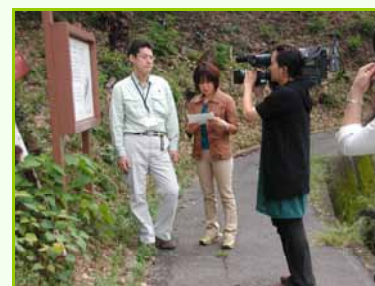
昨年秋には、身近な遺跡として地元のケーブルTVでも紹介されました。