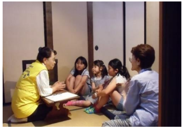
昨年の一コマ。 紙芝居後のこどもたちとのふれあい

広島城が郷土館として開館したのが昭和33年(1958)。今年で58歳になります。広島城ではこの開館日(6月1日)を記念して、「広島城メモリアルデー」を例年開催しています。天守内の展示案内はもちろんのこと、兜の試着体験や、こどもたちと工作やゲームをしたり、クイズラリー等々、盛りだくさんのイベントを天守内外の各所で計画しています。今年も文化財課、郷土資料館、安芸ひろしま武将隊の協力(予定)も得ながら、探検隊の皆さまに、いろいろなコーナーをお願いしたいと思います。盛りだくさんの内容ですから、皆様の多大なるご協力をいただかねば到底実施できるも