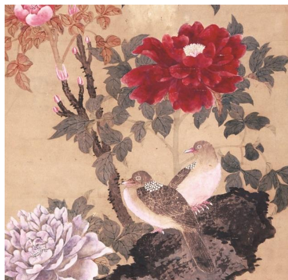
「牡丹双鳩図」小倉武駿筆 広島城蔵

今回の研修では、日本人に親しまれてきた画題やその意味について、展示資料を鑑賞しながら本田学芸員が解説します。実施日は令和4年3月23日(水)です。今回は展