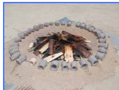
たき火で焼き上げます。