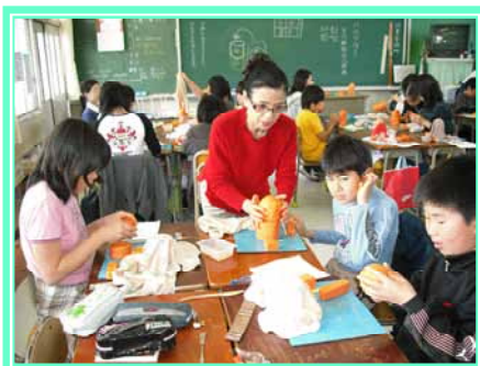
ハニワ作りの様子です

文化財課では年度初めに、小学校からの出張授業の依頼が集中します。6年生になると社会科で歴史を学ぶようになり、この時期にちょうど古代を勉強するからです。そのため、メニューは「土器作り」、「ハニワ作り」、「古代体験」がほとんどです。今年度は昨年度を上回るご依頼があり、4月から毎週のように小学校