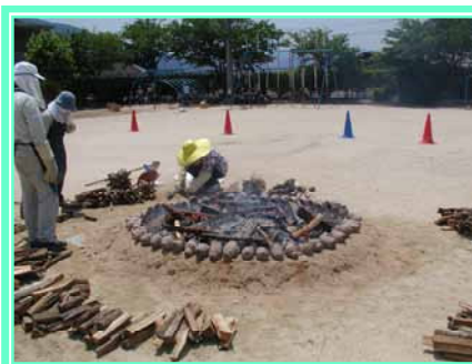
野焼きの様子です