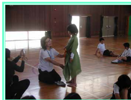
古代体験の様子です