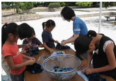
昨年のナイトミュージアム(お話し会)と藍染めTシャツ作り

暑くなって来ました。気温の上昇とともに、資料館もだんだんソワソワしてきます。いよいよイベント目白押しの夏休みがやってきます。「募集しまーす！」のページをごらんいただくと分かるように、夏休み期間中、何もやっていない日がないほどイベントが連続します。加えて「お化けの夏休み」というお化け屋敷も開催します。忙しくて大変なのですが、反面、いろんなことが出来るチャンスでもあります。これまで資料館に来られたことのない方もぜひ覗いてみてください。(郷土資料館 大室)