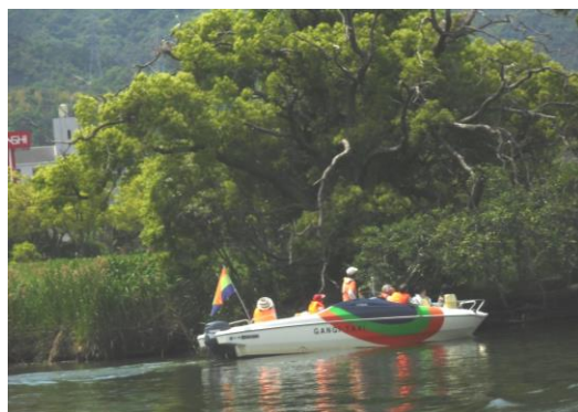
雁木タクシー、鷺島に到着