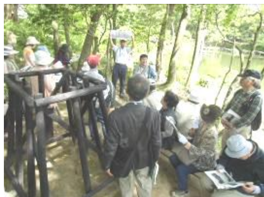
祺福山(きふくさん)にて解説中