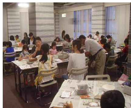
昨夏の出張事業のようす

「縄文ペンダント」と「古代ミニフィギュア」は、粘土を使って縄文時代や古墳時代に作られた土製品をモチーフにした作品を作ります。「まが玉」は、滑石というやわらかい石を削って磨いて、古代のお宝を再現します。材料費として、20日は100円、21日は360円が必要です。参加を希望される方は文化財課にご連絡ください。お待ちしております！（文化財課 田原）