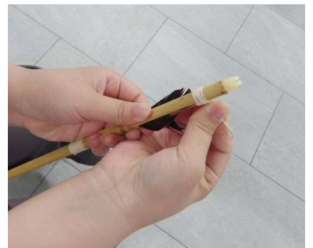
ひもをきつく巻きなおします