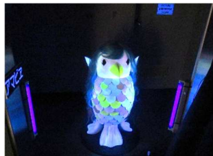
暗闇で光るアマビエ妖怪

これらの活動をご希望の方は3p「募集しま〜す！」にて詳細日時をご覧ください。皆様のご応募お待ちしております ✨