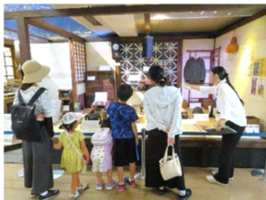
戦時中の家屋を再現しています

します。日程は会期中の毎週水曜・木曜（8月6日は除く）です。必要な方には衣装等をお貸しします。