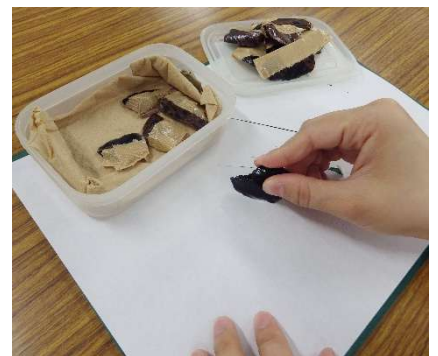
↑紙が切れるか確認中

私たちは、安全に体験できるようにするのはもちろんのこと、道具を長く大切に使うために定期的に確認やメンテナンスをしています。これからも長く体験が続けられるよう、丁寧に取り組んでいきます！