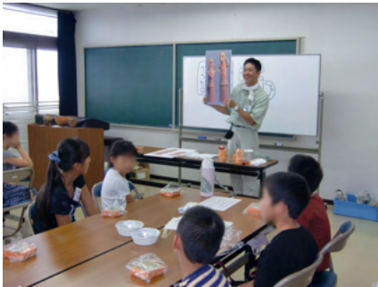
歴史の話や作り方の説明