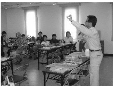
歴史の話や作り方の説明

公民館の研修室で、イベント「夏休み子ども考古学教室」を開催します。事前に申し込んだ小学生20人（3年生以下は保護者同伴）を対象に、10:00~12:00の2時間でミニフィギュアづくりを実施。最初に歴史の話や作り方の説明を聞いて、見本を参考に作って完成させます。文化財課の職員とボランティア数名が指導します。