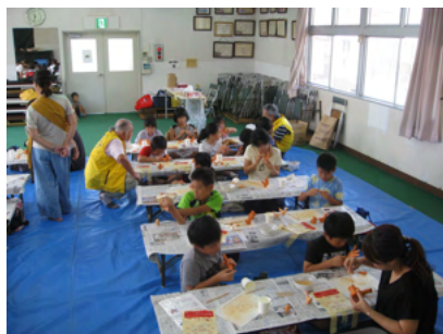
ミニフィギュア づくり