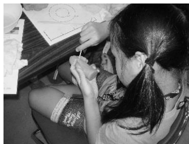
ミニフィギュアの製作